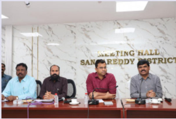
సంగారెడ్డి, భారత శక్తి ప్రతినిధి, ఫిబ్రవరి 09 : ఎన్నికలలో